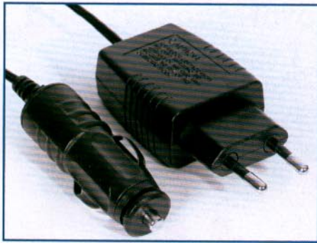
Beiden Ladegeräten liegt ein Adapter für den Zigarettenanzünder im Auto bei.