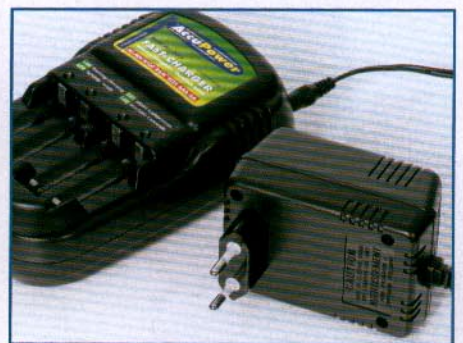
Ab September will Accupower sein Gerät mit Schalt-, statt Spulen-Netzteil (im Bild) ausliefern.

Zahlreiche Digitalkameras nutzen Mignonzellen zur Stromversorgung. Die Batteriehersteller bringen regelmäßig neue Akkus mit erhöhter Kapazität. Doch nicht alles, was nach rasanter Innovation aussieht, bringt auch ein besseres Resultat.