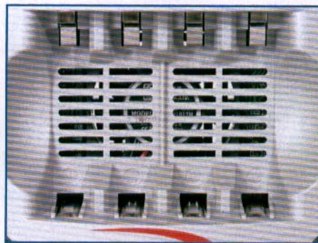
Der Minilüfter im Ansmann-Gerät soll die Akkus beim Ladevorgang kühlen, ist aber recht laut.